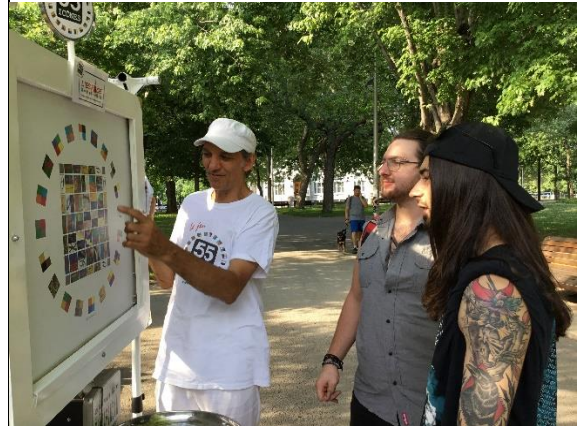
Au Théâtre de Guignol 2017

L'interface 55 ICÔNES représente une image primitive élémentaire : un carré dans un cercle. L'image finale suggère une cohérence logique entre l'organisation de nos souvenirs associés à des représentations symboliques et la construction de nos paysages imaginaires. Le carré dans le cercle est un symbole millénaire ayant servi de modèle à la pensée humaine (monnaie chinoise, mandala indien, réflexion mathématique grecque, etc.) et de cadre mnémotechnique universel pouvant schématiser à sa plus simple expression graphique les assises symboliques d'une structure imaginaire en perpétuel développement.