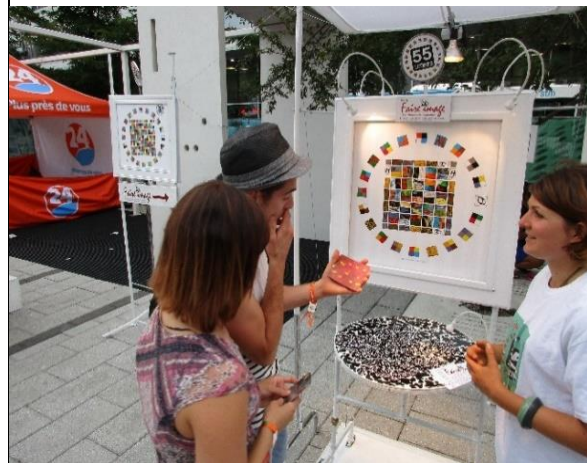
Mondial des jeux 2016