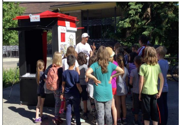
Au Parc La Fontaine à Montréal 2018